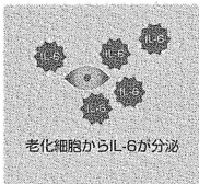
図2 「美郷雪華エキス」に期待できる抗老化作用